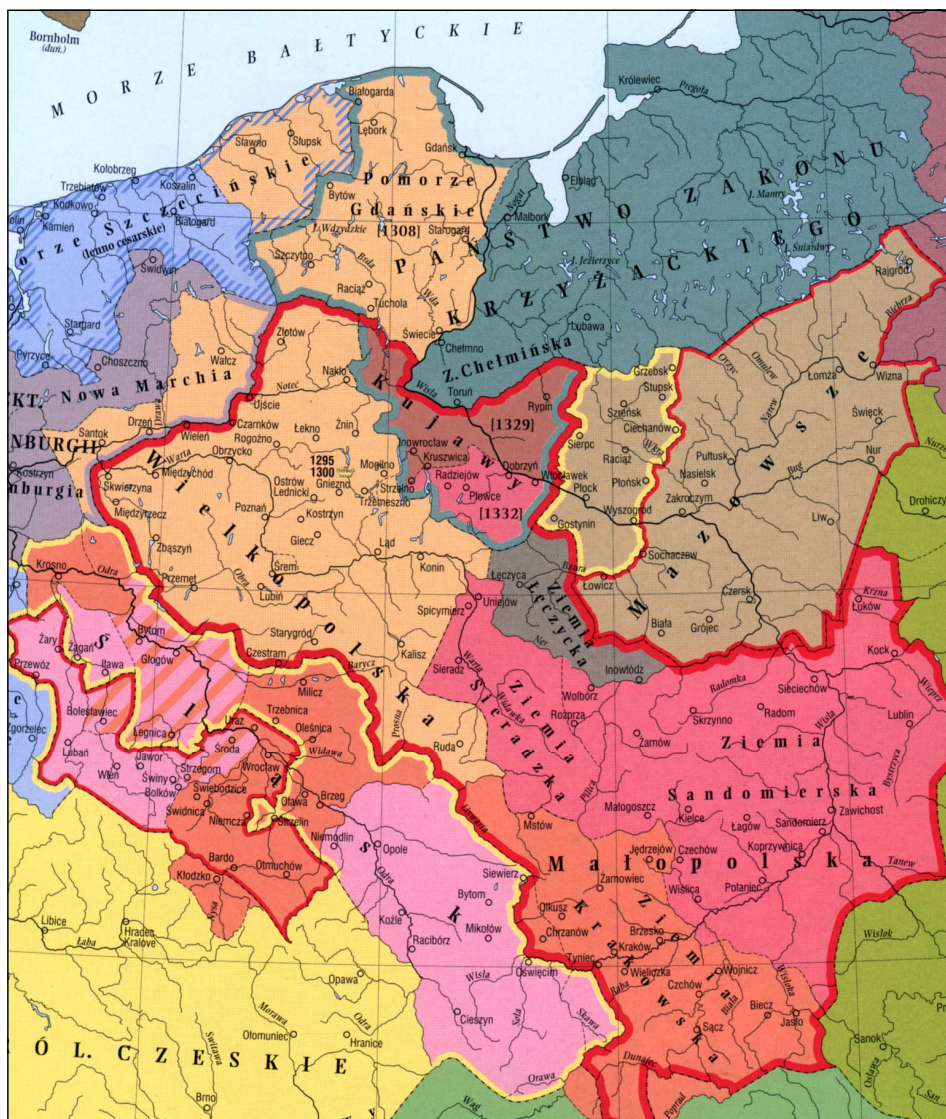
Ziemie polskie u schyłku rozbicia dzielnicowego i odrodzenie Królestwa Polskiego - przełom XIII i XIV w.